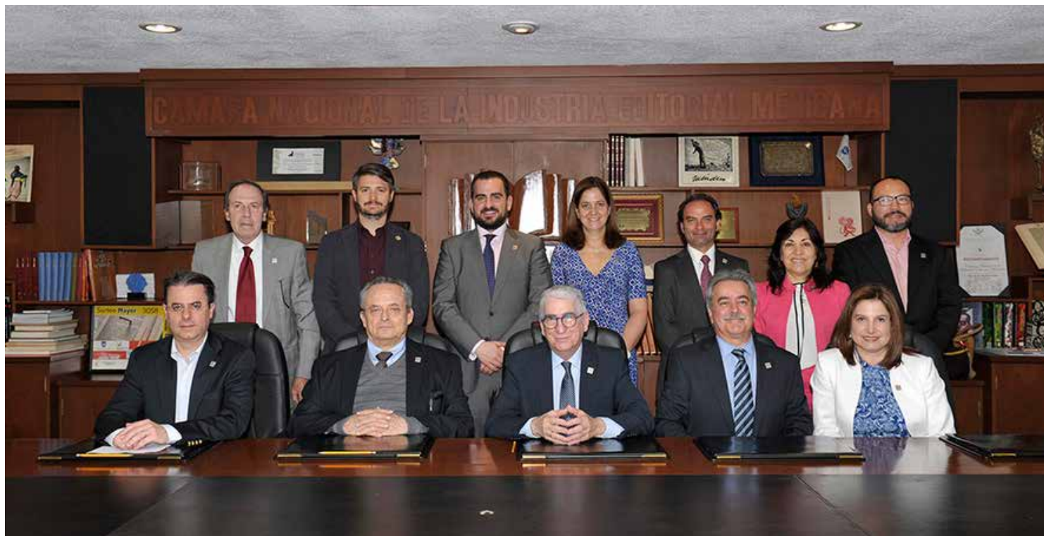
Integración del Consejo directivo 2017-2018.

"Al comunicar lo anterior –señala el comunicado del Consejo Directivo– le agradecemos cumplidamente las atenciones que sean dispensadas a los miembros de nuestro Consejo Directivo en el desempeño de su cargo".